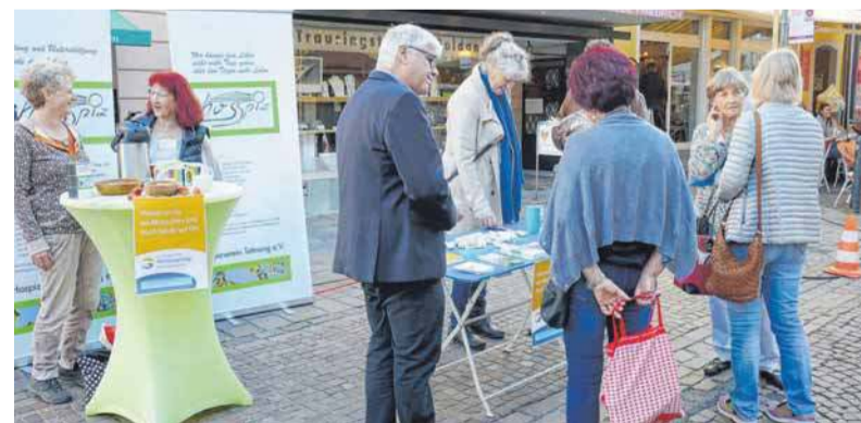
Ehrenamtliche aus der Hospizgruppe und dem Vorstand und die beiden Koordinatorinnen der Einsätze stehen Interessierten auf dem Tettananger Städtlesmarkt Rede und Antwort.

Bei Rückfragen kann auch unter der Telefonnummer 07543 / 63 09 angerufen werden oder eine E-Mail versandt werden an bertl.tettanang@gmail.com